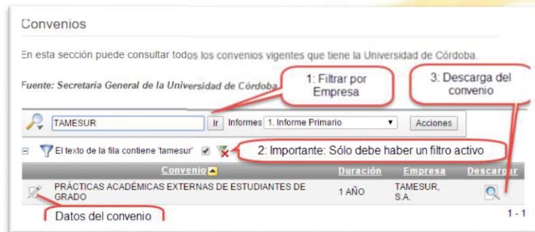
Figura 1. Acceso a los convenios educativos. Portal de transparencia de la Universidad de Córdoba.

Si deseas conocer los convenios de prácticas, pulsa en este enlace y sigue las instrucciones: