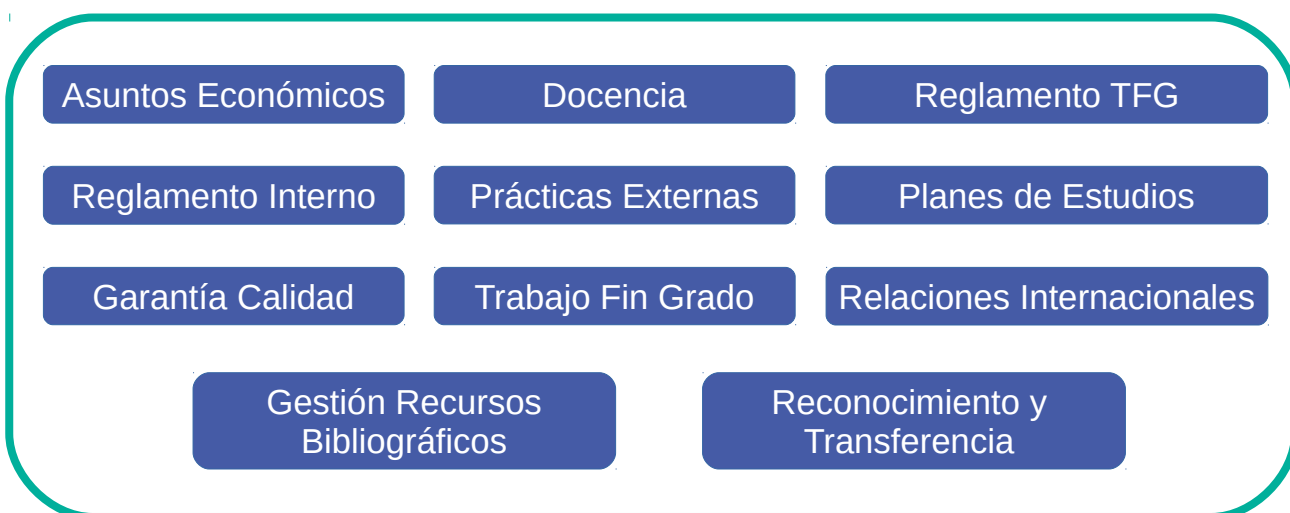
Figura 3: Comisiones actuales de la EPSC

El punto 12 de las funciones recogidas para la Junta de Escuela (ver documento: Organigrama y funciones de los cargos con responsabilidad en el título ), junto con el artículo 28 del Reglamento de Organización y Funcionamiento de la EPSC , permiten a la Junta de Escuela crear las comisiones y subcomisiones que considere necesarias para la mejora del funcionamiento de la Escuela, en general, y de sus grados, en particular.