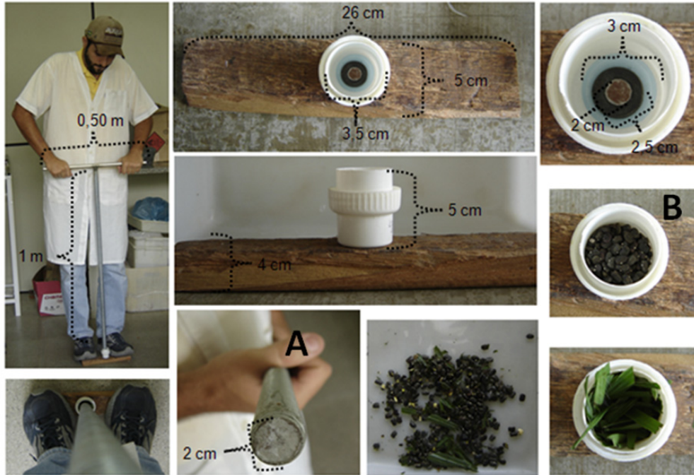
Figura 1. Metodologia de mastigação simulada. A: barra de ferro; B: recipiente de plástico. (Methodology of simulate mastication).

foi realizada a simulação da mastigação com posterior seleção de 50 sementes não destruídas, por repetição, para o teste de germinação. Para o tratamento mastigação com posterior escarificação, foi realizada a simulação da mastigação e seleção de 60 sementes não destruídas, sendo que estas foram escarificadas e selecionadas 50 sementes por repetição para realização do teste de germinação.