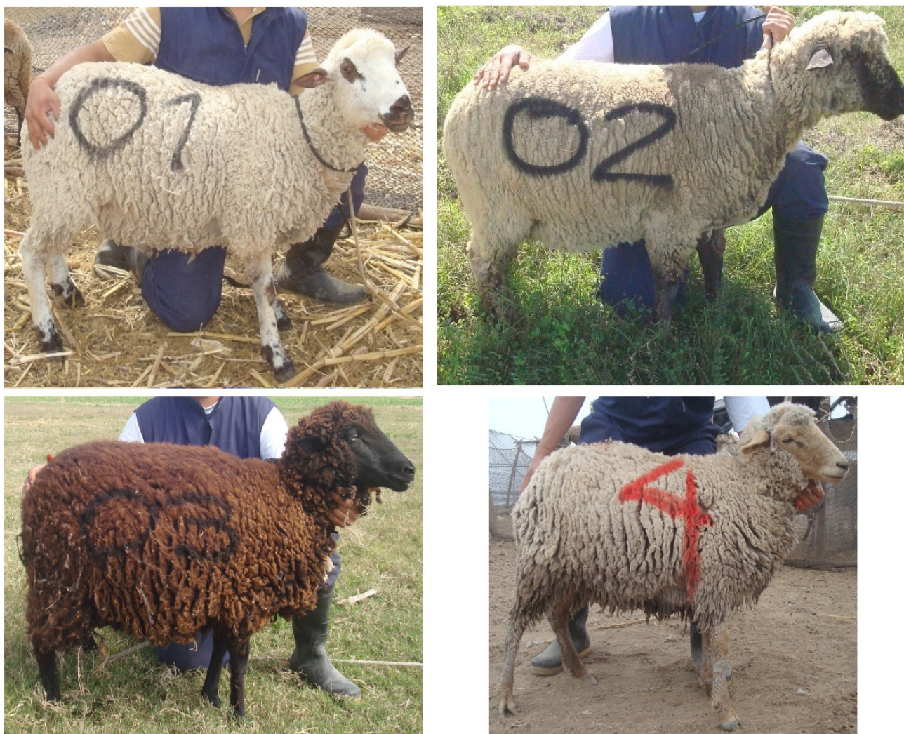
Figura 1. Oveja criolla “cara blanca” (01) y mestiza Hampshire Down “cara negra” (02) de los grupos muestreados. Ovejas criollas negra (03) y castaña (4) en riesgo de extinción (Creole sheep “white face” (01) and Hampshire Down crossbred “black face” (02) from sampled groups. Black (03) and brown (4) creole sheep in risk of extinction).

al., 2005), durante los meses de mayo y junio, tiempo suficiente para el trabajo de campo, además de coincidir con el inicio de invierno, época hasta la cual los ovinocultores mantenían la lana de los animales intacta, para enfrentar el clima litoráneo frío (16°C) y húmedo (86%) de Ite (Vizcarra, 2008). También se registró con un dinamómetro el peso vivo de las ovejas criollas y mestizas, buscando la mejor comprensión del biotipo de los grupos. Las CRICH eran más pesadas (46,8 kg), seguidamente las MHD (45,7 kg), en cuanto las CRIHU más leves y de menor tamaño (38,8 kg). Esta divergencia entre criollas puede ser debido a un linaje diferente, propio de cada ambiente. Otro motivo sería el incidente mestizaje de las CRICH con MHD, promovido por los agricultores para incrementar la aptitud cárnica en sus rebaños. Vale comentar que en los Humedales varios pastores Aymara realizan esas cruza, pero la mayoría de mestizos no desarrollaban plenamente, por el ambiente hostil de ese ecosistema.