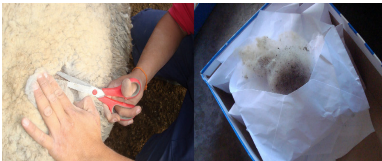
Figura 2. Muestreo de un mechón de lana y su envío postal para México (Sampling of a wool fleece and its posting to Mexico).

48 horas a 22°C y 63% de humedad. Esta sub-muestra fue pesada para obtener el peso limpio (PL), calculando con eso su rendimiento (PL*100/PS) después del desengrase alcohólico (García et al., 2005). Los datos macroscópicos y de rendimiento fueron registrados en planillas electrónicas.