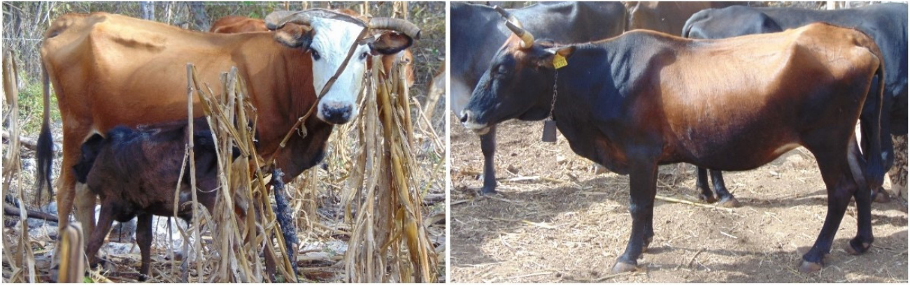
Figura 1. Ejemplares de Vacas criollas de Nunquí, Calkiní, Campeche. (VCN).

años y que contaban con características fenotípicas reportadas en la literatura como para vacas criollas.