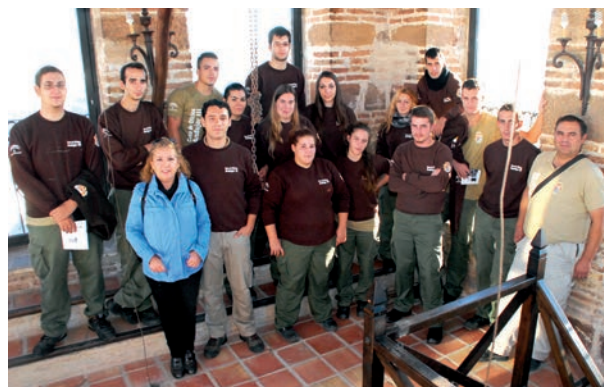
Jornada del Patrimonio Europeo

En noviembre organizamos una Visita al Patrimonio Monumental de la ciudad, enmarcada en las Jornadas Europeas del Patrimonio, que anualmente convocan las instituciones europeas, y que tienen como objetivo establecer una conexión entre los ciudadanos y su patrimonio cultural, a través de visitas gratuitas a monumentos y sitios históricos.