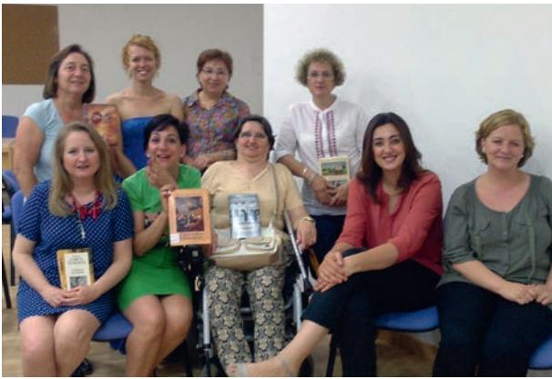
Taller de lectura europeo