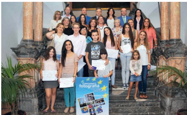
Concurso de fotografía: "Una imagen sobre Europa"

Dirigido a jóvenes residentes en la provincia de Córdoba. Se presentaron 120 fotografías.