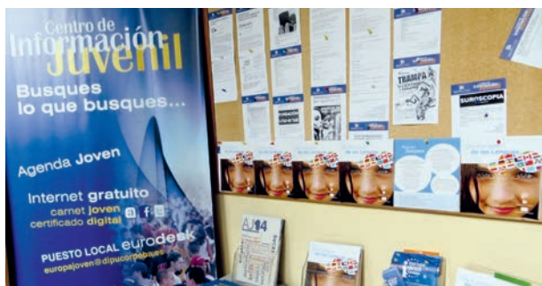
Stand y folleto sobre Día Europeo de las Lenguas

Realización y difusión de un políptico informativo en soporte papel. Con una tirada de 500 ejemplares. El objetivo fue dar a conocer la Semana Europea de las Lenguas y el multilingüismo de la UE.