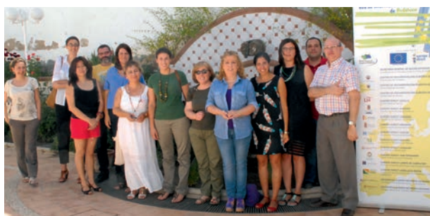
Jornada sobre Redes Sociales para miembros de la RIAE

Celebrada en julio en el Centro de Iniciativa Empresarial y Formación San José.