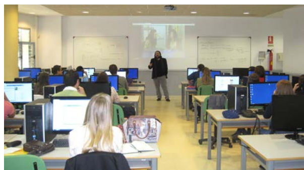
Jornada "Redacción del CV Europass"

El contenido: El CV Europass. Se pidió a los asistentes que se llevaran en un pendrive su foto y CV para trabajar sobre él. La actividad se realizó en el aula informática de la Universidad para facilitar el trabajo.