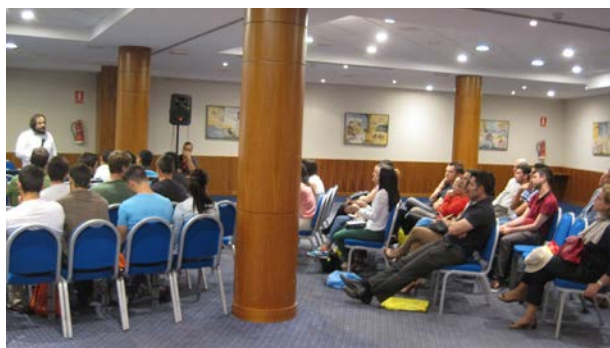
Movilidad en la Unión Europea

Tuvieron lugar en el Hotel Tryp Indalo Almería.