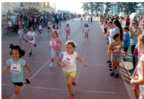
Día de Europa: Deporte por Europa

Como objetivo el acercar el sentimiento de pertenencia y de ciudadanía europea a la población, divulgar información de interés para los grupos objetivo (población general, niños, jóvenes), fomentar la participación ciudadana en actividades europeas. Se volvió a prestar especial atención a los derechos ciudadanos.