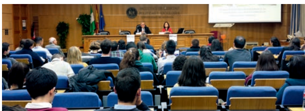
Jornada sobre "Empleo en la UE"

Un año más organizamos la Jornada de Empleo en la UE con el objeto de facilitar información sobre las oportunidades de empleo en la UE y promocionar la presencia de diplomados y licenciados de nuestra Comunidad Autónoma en instituciones comunitarias, dotándoles de conocimientos para participar en los procesos de selección y orientarlos en la búsqueda de empleo en la UE desde un enfoque eminentemente práctico y útil.