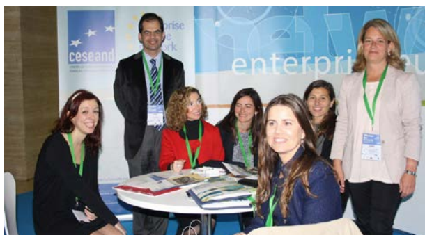
Stand informativo de los servicios de CESEAND durante la MFG Andalucía