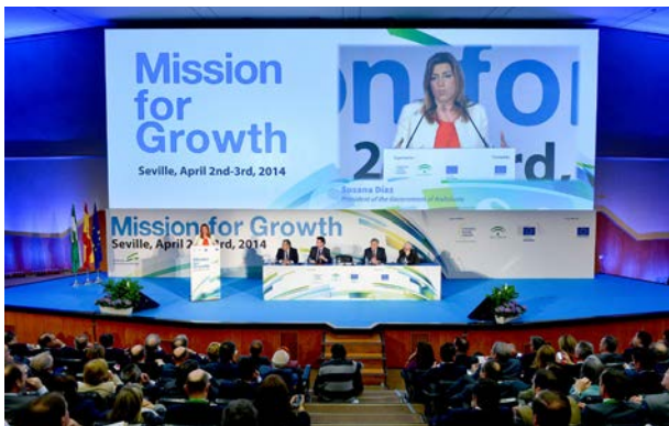
La Presidenta de la Junta Andalucía en la actividad Misión para el Crecimiento

CESEAND, nodo Andaluz de la Enterprise Europe Network, organizó en esta "Misión para el Crecimiento" los encuentros Empresariales cuyo objeto fue facilitar, a través de reuniones bilaterales, oportunidades de negocio entre empresas, permitiendo a los participantes detectar posibilidades de colaboración y conocer nuevos socios comerciales, tecnológicos o para proyectos de innovación.