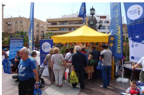
Día de Europa: Punto de Información

Ubicación de Punto de Información y Consulta en Stand situado en la Plaza Alta de Algeciras. Acto de izada de Bandera Europea por parte del Presidente de nuestra Entidad y otros representantes políticos de la Comarca del Campo de Gibraltar. Entrega de material promocional a todos los asistentes, cuestionarios y recogida de consultas sobre la UE.