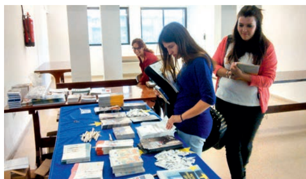
Stand con información en el Día de Europa

Para conmemorar el Día de Europa se han realizado diferentes actividades: stand informativo, panel tematizado y un Seminario en el seno de la Universidad. Se celebró el 22 de mayo.