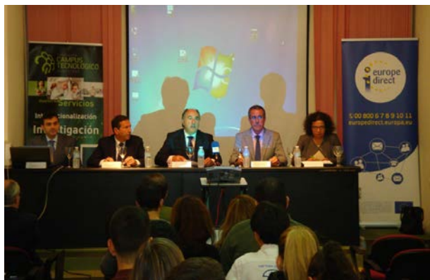
Jornadas Horizonte 2020

La Fundación Campus Tecnológico, en colaboración con nuestra oficina, organizó unas jornadas para dar a conocer las oportunidades de financiación enmarcadas en el Programa Horizonte 2020, que se celebraron el 21 de noviembre en Algeciras.