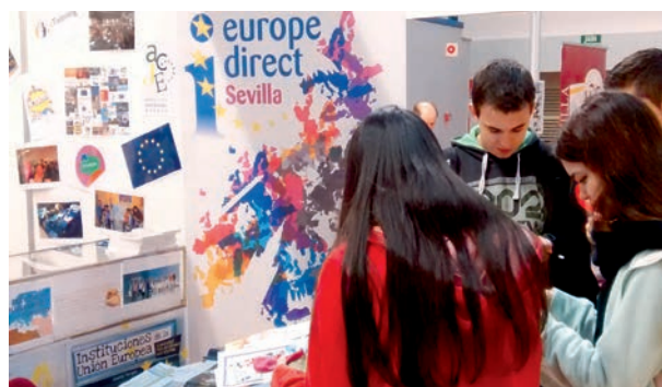
Jóvenes en el Salón del Estudiante