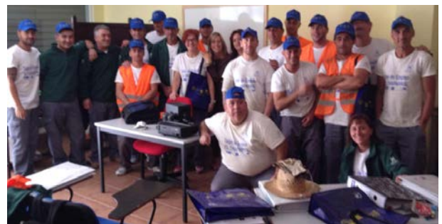
Actividad con el Taller de Empleo El Chaparral

Sesiones Informativas en Escuelas Taller, Talleres de Empleo y Casas de Oficios del Campo de Gibraltar. Presentación de diapositivas y emisión de videos relacionados con el Año Europeo de los ciudadanos y ventajas con las que contamos los ciudadanos europeos. Reparto de material promocional.