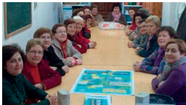
Talleres sobre Parlamento Europeo con Asociaciones de mujeres

Para familiarizar a recientes usuarias o no usuarias de Internet con sus posibilidades en torno al acceso a la información europea, al tiempo que fomentar su alfabetización digital. 15 usuarias formadas.