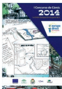
Portada Comic "La Unión Europea forma parte de ti"

Otras Publicaciones : Un Díptico Europe Direct San Fernando, un Mapa Unión Europea, un Puzzle Unión Europea y un Videoclip de Europe Direct San Fernando.