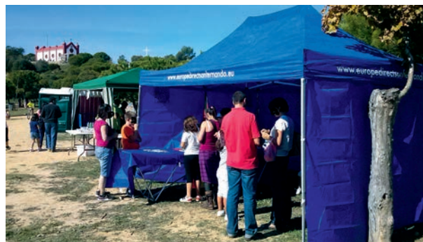
Stand del Centro de Información Europe Direct. Celebración Día del Cerro

Celebrado el 26 de octubre con la inauguración de un stand de carácter promocional y divulgativo sobre las publicaciones y servicios ofrecidos por nuestra oficina; se distribuyeron gran cantidad de folletos y artículos promocionales. Además se realizaron talleres y actividades lúdicas y educativas para el público infantil, impartidas por monitores con amplia experiencia en talleres de animación.