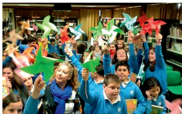
Talleres sobre Energía en las EEPP SAFA

El 26 de marzo nuestra oficina desarrolló en las EEPP de la Sagrada Familia (SAFA), dos talleres titulados "La Unión Europea y la Energía", para los tres grupos de 5º del centro, divididos en dos grupos; la actividad tuvo tres partes, en la primera recibieron información sobre la UE, sus orígenes,