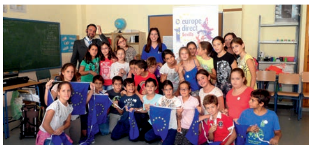
Niños en la actividad "La UE en las Escuelas"

El objetivo era difundir entre los alumnos de primaria los principios y valores de la UE, así como sus símbolos de una forma divertida. 125 alumnos de primaria se beneficiaron de esta actividad.