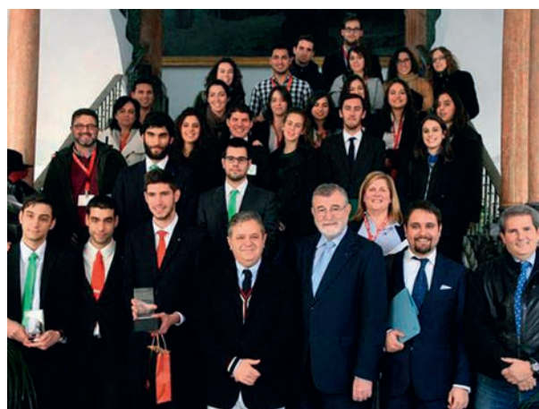
Torneo de Debates Universidad de Córdoba

Del 20 al 23 de octubre. Para universitarios de toda España. No solo estudiantes y jóvenes, sino también miembros de la sociedad civil de Andalucía, como profesores de la Universidad de Córdoba, militares destinados en la base de Cerro Muriano, abogados, fiscales y jueces de Córdoba y provincia, escritores y artistas.