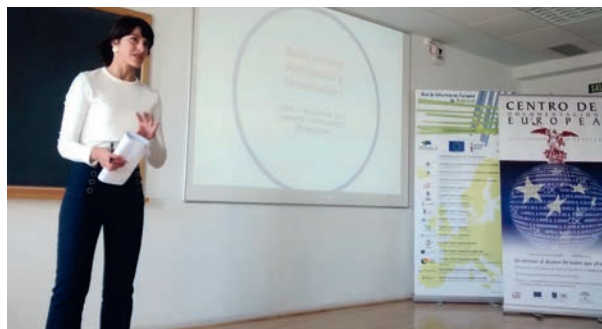
Curso sobre la Unión Europea

De 30 horas lectivas. Para formar a alumnos de la Facultad de Ciencias de la Comunicación y periodistas en cuestiones básicas sobre la UE: historia, instituciones, ordenamiento jurídico, políticas comunes, etc. Este curso tiene 3 créditos de libre configuración y concluyeron la formación 46 alumnos.