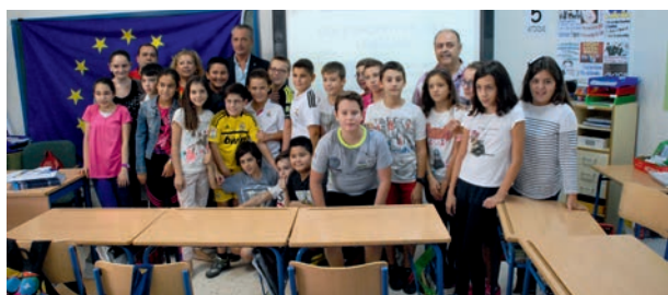
Actividad Día Europeo de las Lenguas en el CEIP Capitán Cortés

Actividad lúdico/informativa para celebrar este día. Este año, el día 26 de septiembre, trabajamos con dos grupos de 6º de Primaria del Colegio Capitán Cortés , y llevamos a sus alumnos juegos, concursos y otros métodos para concienciarlos de la importancia de conocer al menos otra lengua, además de la materna.