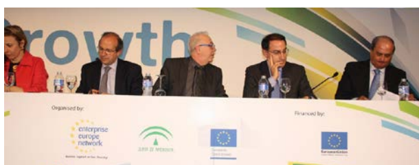
Participantes en una de las mesas redondas de la MFG Andalucía

Como resultado 964 empresas o instituciones participaron en el encuentro, donde se habían cerrado más de 2.400 reuniones que permitieron a las empresas andaluzas identificar y ser identificadas como posibles socios de negocio e inversión, en sus actividades comerciales, tecnológicas, y de internacionalización.