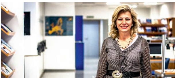
Entrevista en la TV a la directora del ED