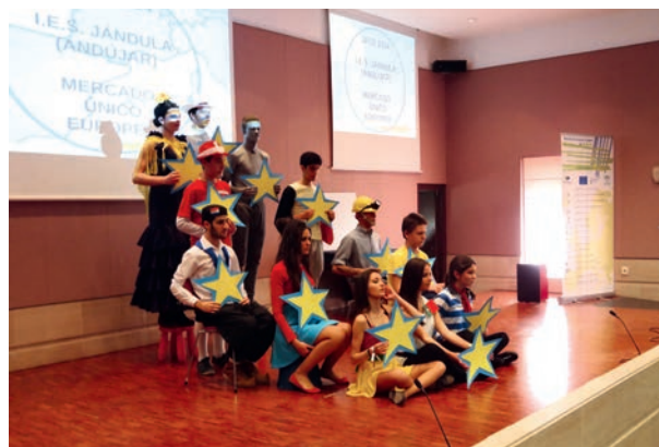
Alumnos del IES Jándula en su actuación de JACE

Una vez que el IES JÁNDULA DE ANDÚJAR , fue seleccionado para participar en el VIII Concurso Escolar JACE, realizamos una sesión informativa con tres cursos de 1º de Bachillerato, para darles información de la actividad y hablarles sobre el MERCADO ÚNICO Y POLÍTICA INDUSTRIAL , tema sobre el que trabajaron y realizaron la representación en Mollina (Málaga). Asistieron 20 alumnos y 2 profesores.