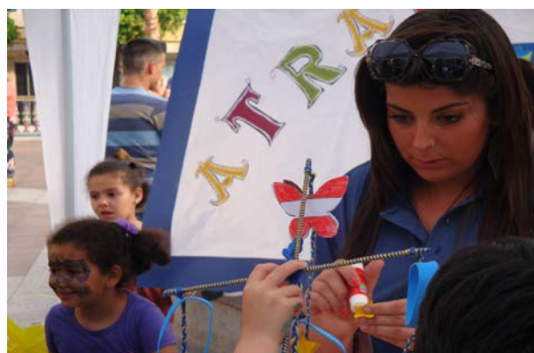
Día de Europa: Talleres Didácticos