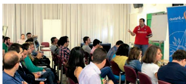
Taller sobre Movilidad en la UE en Mollina (Málaga)

El 19 de octubre tuvo lugar en Mollina (Málaga) una Jornada organizada por Avante Sur (Sevilla) en la que intervino nuestra oficina. Se habló de Movilidad en la UE para 85 asistentes.