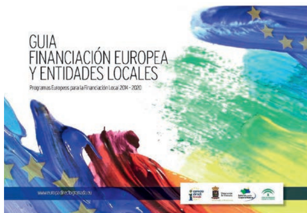
Portada de la Guía de Financiación Europea y Entidades Locales

El resultado final es una herramienta fundamental para las corporaciones municipales de la provincia de Granada interesadas en conseguir financiación comunitaria para sus proyectos.