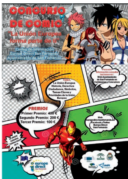
Cartel Concurso de Cómics Europe Direct San Fernando