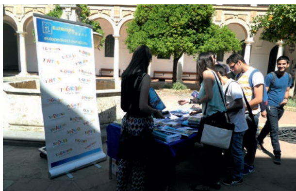
Algunos alumnos y alumnas en el stand instalado el Día de Europa

Con motivo de la Conmemoración del Día de Europa realizamos un stand en la Facultad de Derecho y Ciencias Económicas y Empresariales al que acudieron numerosos alumnos y alumnas y profesores y profesoras.