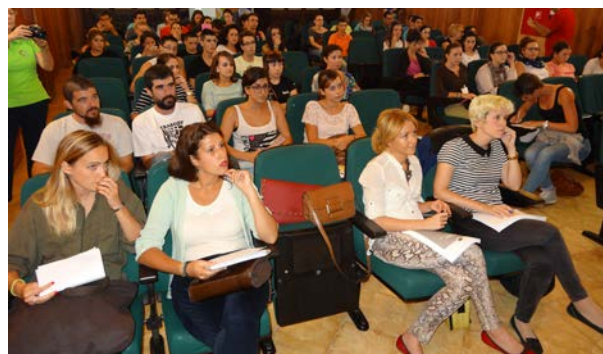
Participantes al acto de clausura