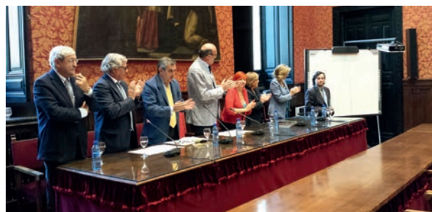
El galardonado del Premio de Investigación sobre Integración Europea

La Red de Información Europea de Andalucía convocó el "VIII Premio Andaluz de Investigación Universitaria sobre Integración Europea". Damos publicidad y difusión de las bases del premio a través del sitio web de la Red, correo electrónico y envío de carteles y folletos a instituciones y organismos público y privado de las ocho provincias andaluzas.