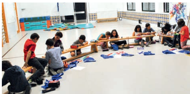
Niños en la actividad "La UE en las Escuelas"

El ED se puso en contacto con una empresa de animación para organizar un Cuentacuentos denominado "La maleta de Schuman" cuyo fin era trabajar con los alumnos de primaria cuestiones básicas relacionadas con la UE (países, símbolos, historia, etc.). Esta actividad se completaba con un taller de chapas en el que los alumnos podían crearse su propia chapa haciéndose un dibujo relacionado con la UE y convirtiéndose en embajadores de la Unión.