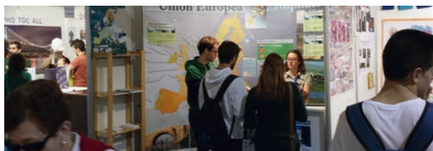
Stand en Jornada de Recepción de Estudiantes

Los días 15 y 16 de octubre el CDE estuvo presente en estas jornadas proporcionando información y documentación sobre los servicios y actividades del CDE de Granada. Este año contamos con la presencia del EU Careers Ambassador nombrado por la Oficina EPSO.