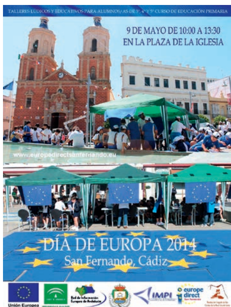
Cartel Día de Europa 2014

Los actos estuvieron acompañados de numeroso público y contó, como en años anteriores, con la presencia de los medios de comunicación, prensa, radio, televisión y digital, local y provincial que informaron de las actividades realizadas.