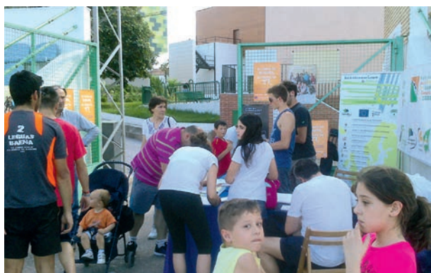
Día de Europa: Punto de Información

Participación de más de 1000 personas en las distintas actividades y amplia difusión comarcal del Día de Europa.