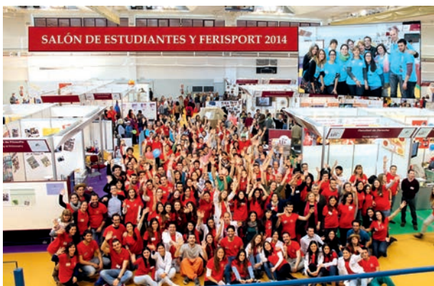
Asistentes en el Salón del Estudiante y Ferisport 2014

El CDE ha participado junto al Europe Direct Sevilla en dos Ferias organizadas en los meses de abril y septiembre.