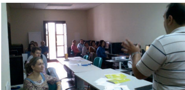
Talleres sobre la vendimia francesa y empleo agrícola

El 3 y el 16 de Julio organizamos sesiones informativas para las personas en renta de inserción agraria interesadas en la Vendimia en Francia. Se enmarcan dentro de las actividades de la Bolsa de Movilidad Europea de nuestro centro.