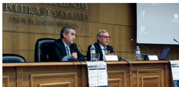
Ponentes en la Jornada "Empleo en la UE"