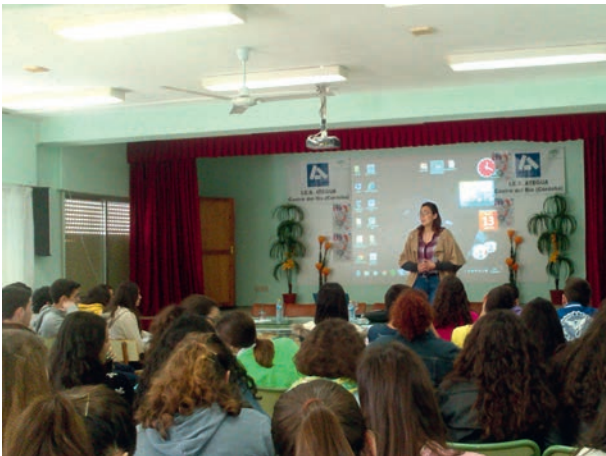
Taller de Orientación en el IES Ategua

Para 300 jóvenes durante la mañana, y por la tarde se llevó a cabo un taller para padres junto con la orientadora del centro educativo. Información para incluir el espacio europeo entre las posibilidades que barajan los recién titulados en FP o las personas que deciden seguir estudiando y hablar sobre las diferentes posibilidades que pueden tener los jóvenes en el marco de programas europeos o de sus derechos como ciudadanos de la UE.