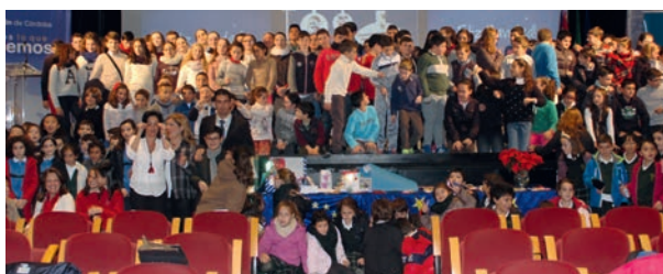
Participantes en el encuentro de Intercambio de adornos navideños