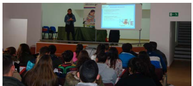
Jornada de Ciclos Formativos