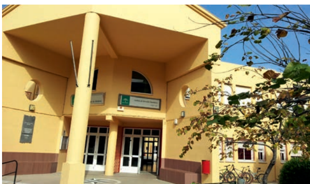
Fachada principal IES Jorge Juan de San Fernando

En algunas ocasiones, las sesiones dedicadas al Programa Erasmus + se realizan en colaboración con la Delegación Provincial del Instituto Andaluz de la Juventud.