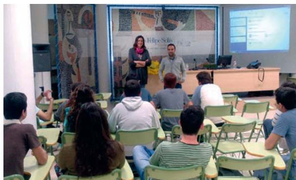
Entrega de regalos al grupo participante en JACE

El centro seleccionado fue el IES Felipe Solís Villechenous, de Cabra (Córdoba) con el que se llevaron a cabo dos sesiones previas al encuentro en Mollina, además de un acto de entrega de un recuerdo de su participación, tras el desarrollo de la fase final de JACE, que fue organizado en el propio centro educativo participante.