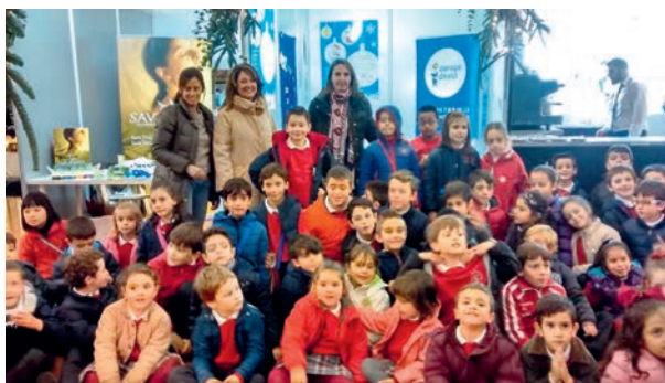
Niños visitantes en el Mercado Navideño

Celebrado el 5, 6 y 7 de diciembre, esta primera edición, organizada por la Diputación de Córdoba, a través del Consorcio Provincial de Desarrollo Económico, ha supuesto un plus en la oferta turística y comercial, y ha reunido a unos 25.000 visitantes en la explanada del Palacio de la Merced.