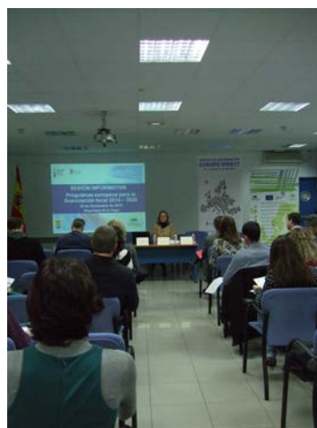
Asistentes a la Sesión Informativa sobre Financiación Local 2014/2020

Un total de 100 técnicos/as municipales de cuatro comarcas de la provincia de Granada se han beneficiado de esta formación.