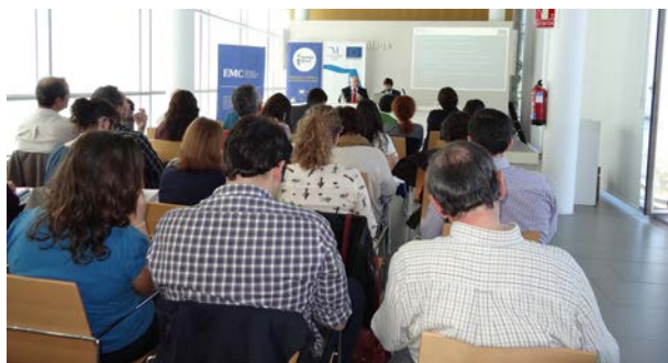
Participantes en la Jornada "Nuevo Marco Presupuestario 2014-2020"

El objetivo fue dar a conocer los programas y las iniciativas que la UE pone en marcha para el periodo 2014-2020 y que pueden contribuir a la cofinanciación de proyectos que se plantean desde esta Diputación y a los cuales también pueden acceder las entidades locales.