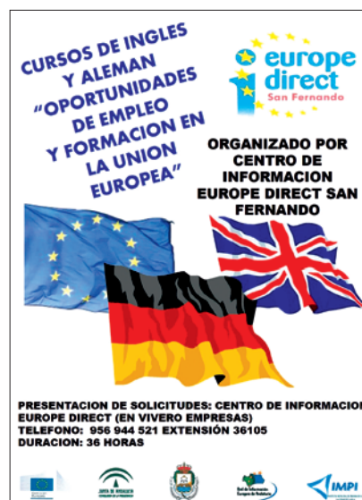
Cartel Cursos Idiomas Inglés y Alemán

El objetivo era alcanzar por parte del alumnado un mayor conocimiento y fluidez en la comunicación con ciudadanos de otros países, y potenciar las destrezas y capacidades comunicativas en los idiomas impartidos y utilizarlos como una herramienta adicional en actividades ligadas a la formación, a nivel educativo y laboral y, con ello mejorar sus oportunidades de empleo en el ámbito nacional y en los países de la Unión Europea. Muy buena acogida, como en años anteriores, por parte de la ciudadanía.