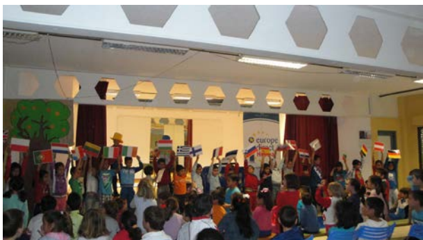
Cuentacuentos sobre la Unión Europea

los municipios han sido: Chucena, Villalba, Santa Ana la Real, Beas, San Bartolomé, El Almendro, Almonaster, Ayamonte, Huelva, y Villablanca.