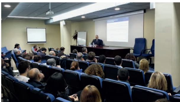
Jornada sobre Plan de Inversiones

Impartida el 4 de diciembre por D. Juergen Foecking, Consejero Económico en la Oficina de Representación de la Comisión Europea en España. El tema suscitó gran interés ya que, ante los riesgos de una nueva recesión, la Comisión Europea avanzó un macro plan de inversión de 300.000 millones de euros con un nuevo vehículo financiero público-privado: el "Paquete Juncker".