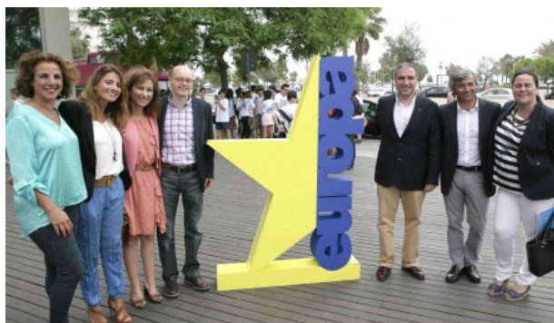
El Día de Europa se celebró en el Auditorio Edgar Neville de la Diputación de Málaga

Los objetivos de la celebración fueron dar a conocer la importancia del Día de Europa, y de los valores de la UE. Se dio a conocer la historia de la UE y su importancia en nuestra vida cotidiana. Con actos lúdicos se trata de aprovechar el evento para difundir los derechos de la ciudadanía.