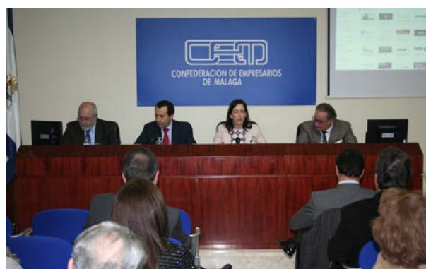
Participantes en la Jornada

El objetivo de la jornada organizada por el CESEAND de CEA es sensibilizar al tejido empresarial de la necesidad de llevar a cabo un proceso de reindustrialización en Andalucía, y difundir las medidas y programas que, con este fin, les ofrecen la Comisión Europea, el Gobierno de España y la Junta de Andalucía, ya que Andalucía afronta un problema debido a la baja aportación del sector industrial comparado con el resto de Europa y es un hándicap a la hora del alcanzar el objetivo del 20% del PIB en el año 2020.