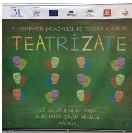
Cartel del IV Certamen provincial de Teatro Escolar

Celebrado en mayo, Teatrízate es un certamen para grupos de teatro integrados por escolares de Primaria, Secundaria y Bachillerato. ED Málaga participó en la fase final del certamen, en la que se realizó una actividad de animación relacionada con la Unión Europea con música y juegos para los escolares asistentes. Se distribuyó material divulgativo para los participantes en la gala inaugural. Para el resto de sesiones de la fase final se contó con un stand de Europe Direct que distribuyó mapas, folletos y material de otros proyectos europeos.