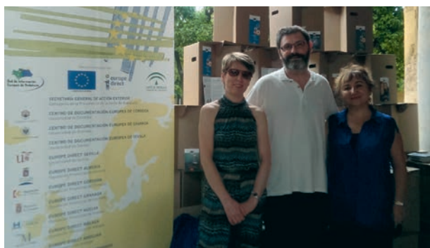
Personal CDE en el stand de la Noche de los Investigadores

El Centro de Documentación Europea ha participado, un año más, en la organización y presentación de la Noche de los Investigadores. En esta ocasión este Acto se ha celebrado en el patio de los Naranjos de la Mezquita-Catedral de Córdoba con una importantísima afluencia de alumnos y alumnas de la Universidad, jóvenes de secundaria y público en general. El personal del Centro de Documentación Europea estuvo en el stand de éste atendiendo a todas las personas que quería saber e informarse sobre cuestiones de la UE y del propio Centro para visitar y solicitar documentación.