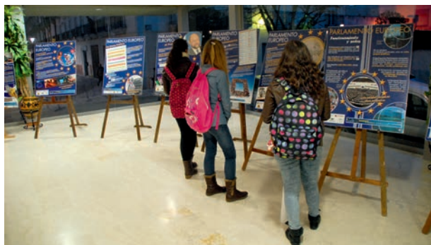
Exposición sobre Parlamento Europeo en el Teatro Principal

Dentro del plan de trabajo previsto en la Subvención concedida a nuestra oficina por la Comisión Europea para la difusión de las Elecciones al PE, figuró la realización de una exposición con 12 paneles con información sobre el PE; son paneles explicando los orígenes, historia, composición, grupos políticos... cuál es el papel del PE en los medios de comunicación, premios que concede, etc.