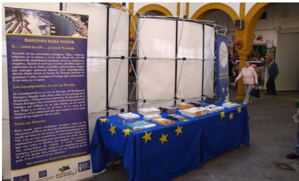
Exposición sobre el Parlamento Europeo

El voto en las elecciones europeas es la oportunidad que el ciudadano tiene para influir en la composición del PE y en las decisiones de este durante los cinco años de legislatura; con el objetivo y de motivar a los ciudadanos a que voten en las elecciones al PE se organiza esta exposición en los siete