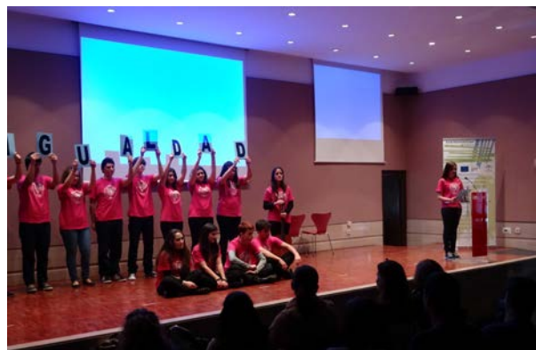
Representación escénica del alumnado del centro escolar.

A la provincia de Málaga le correspondió el tema "IGUALDAD DE OPORTUNIDADES ENTRE HOMBRES Y MUJERES EN LA UE". Después de remitir las bases e información del premio a 120 centros de Bachillerato y de ciclos formativos de grado medio, se presentaron diversas propuestas, y resultó seleccionada la de los alumnos de 1º de Bachillerato del I.E.S. Dr. RODRÍGUEZ DELGADO, de Ronda, que presentaron en Mollina, en la fase final, una composición mixta de teatro, proyección audiovisual y acompañamiento musical. El centro quedó en tercer lugar.