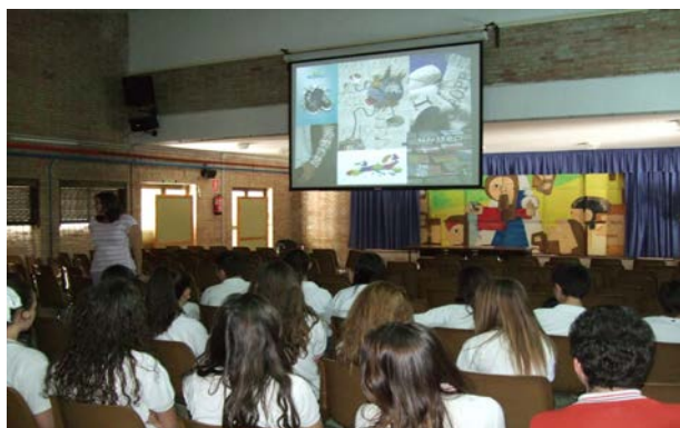
Celebración del Día de Europa en el centro educativo Caja Granada

Al acto asistieron, jugaron y participaron activamente del debate más de 200 jóvenes de 1º y 2º de bachillerato y 3º y 4º de ESO de este cativo.