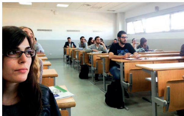
Asistentes al curso sobre la Unión Europea

De 30 horas lectivas. Para formar a alumnos de la Facultad de Ciencias de la Comunicación y periodistas en cuestiones básicas sobre la UE: historia, instituciones, ordenamiento jurídico, políticas comunes, etc. Este curso tiene 3 créditos de libre configuración y concluyeron la formación 46 alumnos.