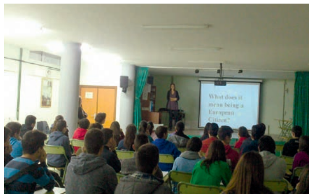
Campaña bilingüe sobre ciudadanía dirigida a IES

Se difunde entre todos los centros de secundaria de la provincia que imparten bachillerato, los institutos pueden elegir día, número de sesiones e idioma (español o inglés). El personal del ED se desplazó a los 17 centros solicitantes de educación secundaria, con el objetivo de comunicar a los jóvenes sus derechos como ciudadanos europeos que les ofrece oportunidades en relación con la educación, formación y el empleo en la UE. 2.000 jóvenes participaron en las 50 sesiones.