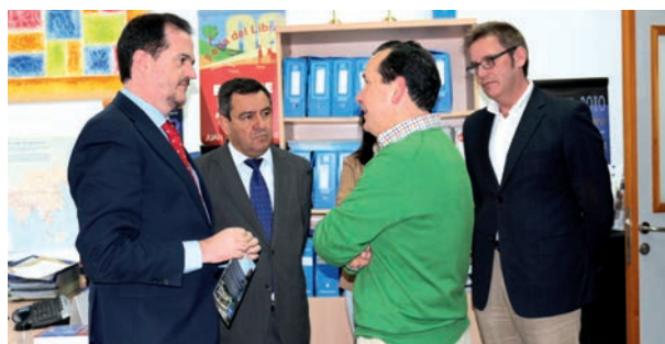
Visita de D. Carlos Iturgáiz

El motivo principal de la visita fue conocer las actividades y servicios que presta nuestra oficina. Durante la misma estuvo acompañado por el Sr. Alcalde de la ciudad y por la mayoría de los Delegados/as del Ayuntamiento. Al finalizar se llevó a cabo una rueda de prensa, en nuestras instalaciones, ante los medios de comunicación locales y regionales.