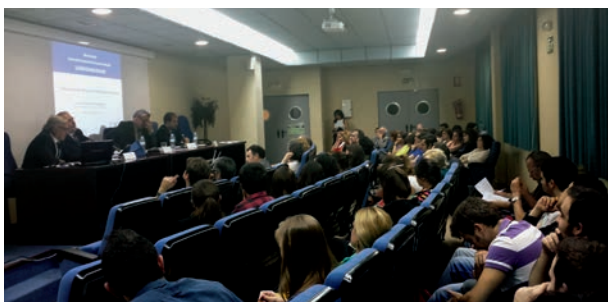
Participantes en la actividad "La UE renovada"