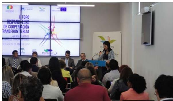
I Foro Hispano-Luso del Sur de Cooperación Transfronteriza

El día 26 de junio el Centro de Información Europea organizó, junto con otros servicios de la Diputación de Huelva, un gran evento Transfronterizo en nuestra provincia que reunió a destacadas personalidades de ambos lados de la frontera, así como a especialistas en la materia. En el mismo participaron representantes de las instituciones europeas y de instituciones nacionales y regionales, españolas y portuguesas, que trabajan en la cooperación transfronteriza.