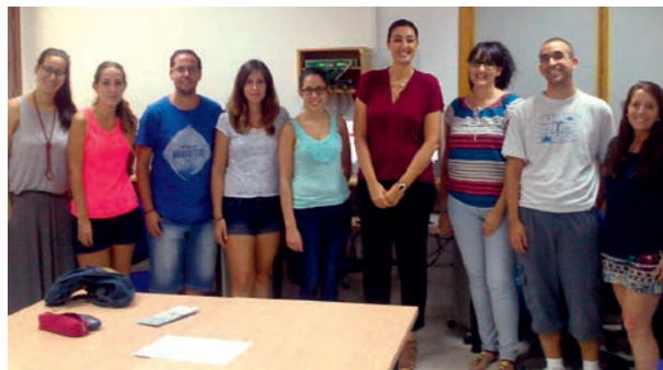
Ciudadanía europea en inglés

El objetivo acercar a los jóvenes la importancia de participar activamente en el proyecto europeo y aumentar su conocimiento sobre los derechos que tienen como ciudadanos europeos. Conocer la diversidad cultural y fomentar su interés por el aprendizaje de otras lenguas. Participaron 23 jóvenes.