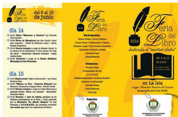
Cartel Feria Libro

El objetivo principal es dar a conocer al público las publicaciones sobre la UE, para ello son distribuidos un número elevado de revistas, folletos, carteles, mapas, etc. procedente de la Oficina de Publicaciones de la UE. Las publicaciones tratan distintos temas como Desarrollo Sostenible, Educación y Formación, Presupuesto de la Unión Europea, Instituciones Europeas, Políticas de la Unión Europea, etc.