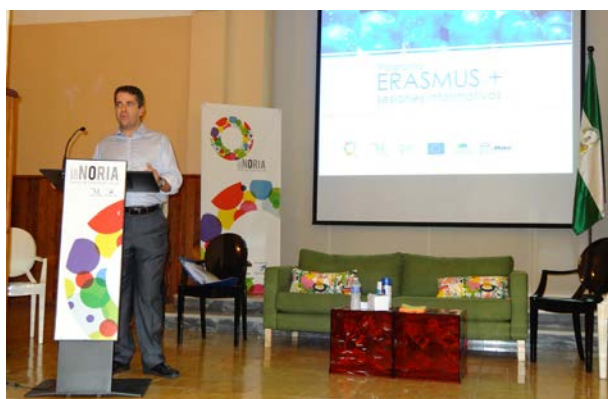
Clausura del acto con presencia del Diputado de Presidencia

Las sesiones se realizaron, de manera presencial, en Antequera, Archidona, Benalmádena, Campillos, Cártama, Pízarra, Rincón de la Victoria, Ronda, Vélez-Málaga, Yunquera y en Málaga capital.