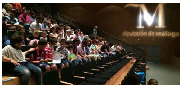
Vista general del auditorio con los participantes al certamen

Los objetivos eran difundir entre los escolares, especialmente a los de Primaria, nociones básicas sobre la UE, exponer los principales valores sobre los que se asienta, concienciar a los escolares sobre la importancia de unir fuerzas, actuar conjuntamente y trabajar en equipo.