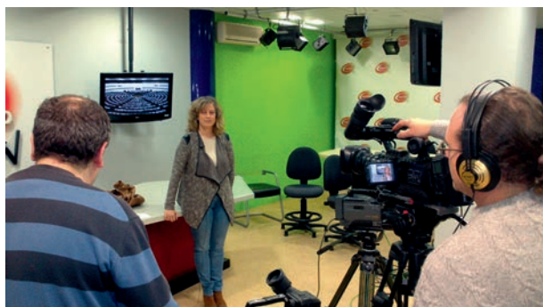
Programa en TV sobre Parlamento Europeo

Programas especiales de Radio y televisión sobre el papel del Parlamento Europeo y la importancia de las Elecciones europeas.