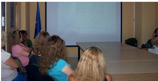
Alumnas Sesiones Informativas impartidas por Europe Direct San Fernando

Se ofrece una especial dedicación a los temas relacionados con la Juventud (Programa Erasmus +, Juventud, Eurodesk, Ploteus, Eures y otros).