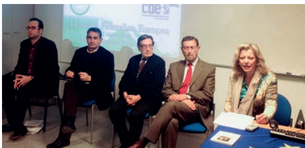
Participantes en la I Jornada Federalista en Sevilla