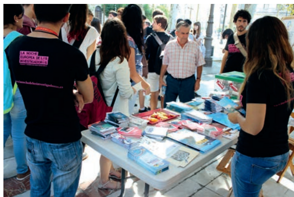
Stand en la Noche Europea de los Investigadores

Para esta actividad se pusieron dos stands con material de divulgación y merchandising, relacionados con la política de juventud, formación y empleo en la UE y la política de investigación y desarrollo en la UE.