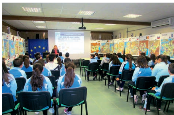
Talleres sobre la UE en las EEPP SAFA

El 4 de abril, en las EEPP SAFA, y para los tres grupos de sexto de primaria, repartidos en dos talleres de 50 y 25 niños, realizamos dos actividades con diferentes apartados; una charla sobre la UE, sus orígenes, instituciones, políticas y logros; entrega a cada alumno de un ejemplar del comics "All us space" con explicación de los adelantos científicos a través de los satélites espaciales gracias a las subvenciones de la UE; además, y con una exposición de 27 paneles con mapas de los países de la UE, se les entregó un cuestionario con preguntas de los países, que tenían que responder encontrándolas en los mapas.