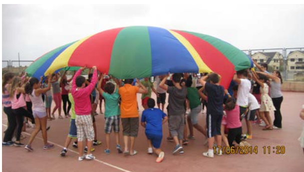
Actividades en la Semana Europea de la Energía

Con motivo de la Semana Europea de la Energía, nuestra oficina ha organizado dos Gymkanas energéticas dirigidas al alumnado de dos cursos diferentes del CEIP "Pura Domínguez" de Aljaraque. Estas dos sesiones tuvieron lugar el 17 de junio.