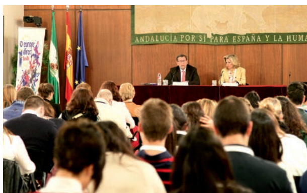
Jornada "Tú, ciudadano europeo"

El ED Sevilla ha organizado tres Jornadas dirigidas a un público amplio. Las dos primeras fueron fruto del Convenio específico que se suscribe con la Comisión Europea y cuyo objetivo fue hacer un ejercicio de difusión de las actividades y del papel que juega el Parlamento Europeo en nuestras vidas.