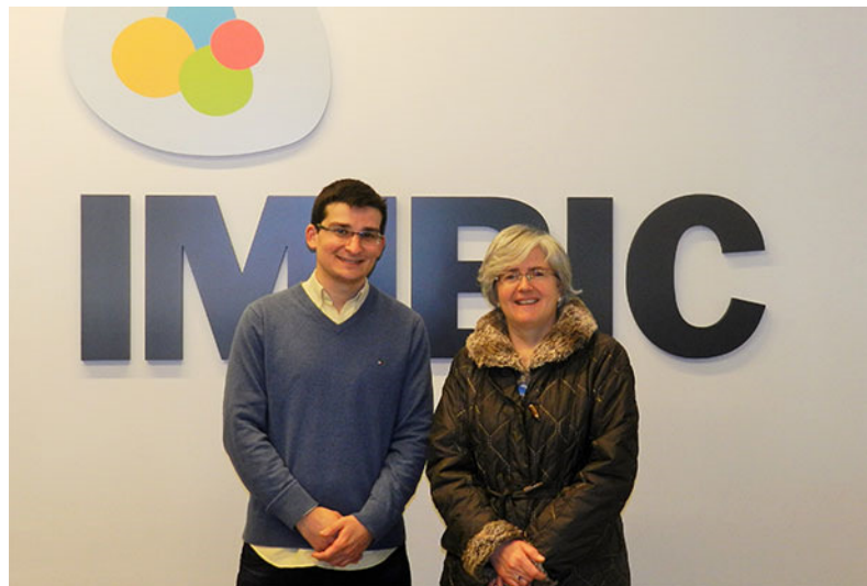
Dos de los investigadores que participan en el proyecto del Imibic

El grupo de investigación en Enfermería del Imibic desarrolla un estudio con investigadores de Italia y Portugal para conocer factores de riesgo de las caídas de los mayores de 65 años