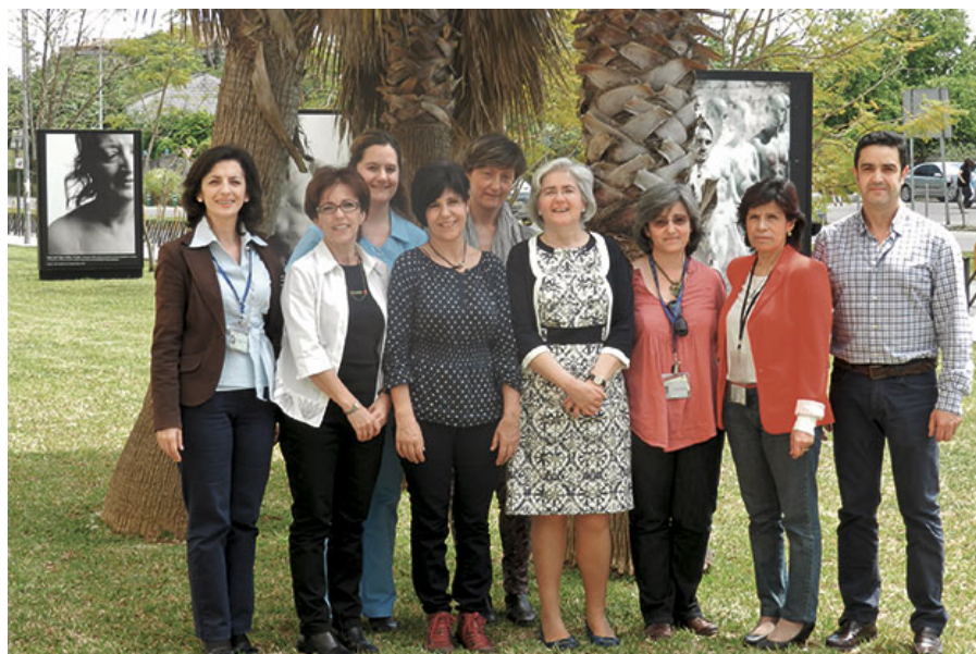
Grupo de investigación

El grupo de investigación en Cuidados Enfermeros ha presentado esta investigación a la Secretaría de Estado de Servicios Sociales e Igualdad del Ministerio de Sanidad