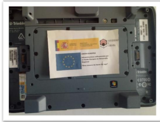
Figura 2. Equipo portátil de posicionamiento para obtención y registro de coordenadas de puntos geográficos. Trimble ROD-GNSS Range Pole