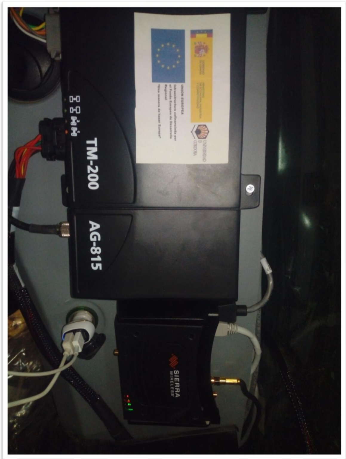
Figura 4. Modem para la recepción de señales de corrección mediante conexión 3G. Trimble Sierra Wireless GX450