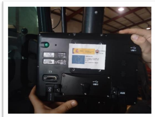
Figura 3. Pantalla universal para el control de maquinaria. Trimble TMX-2050