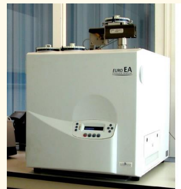
Imagen 1. Analizador elemental EA 3000

Este instrumento está equipado con el software Callidus ver 5.1 para poder realizar el control de equipo, análisis de muestras, procesado de los resultados así como gestión y conservación de los datos obtenidos y obtenidos.