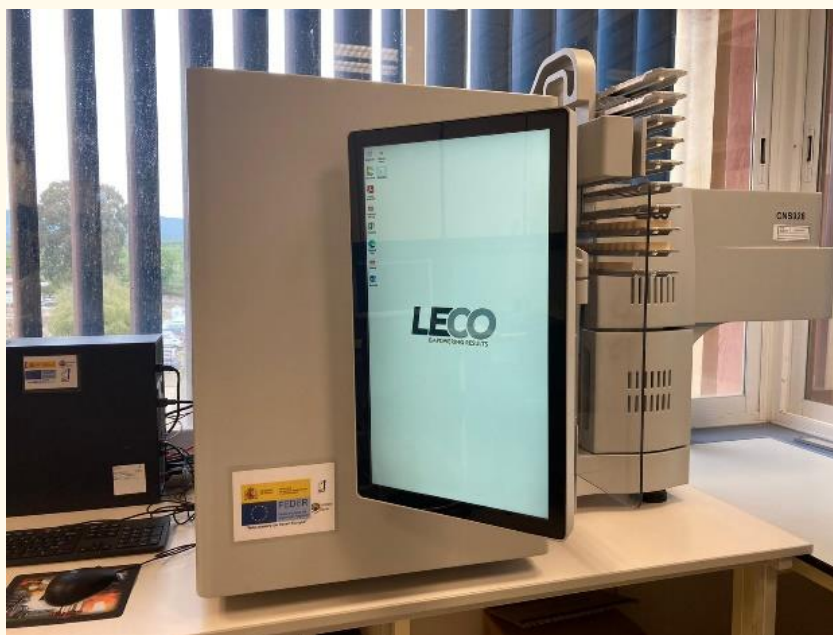
Figura 1. Macroanalizador CNS Leco Serie 928.