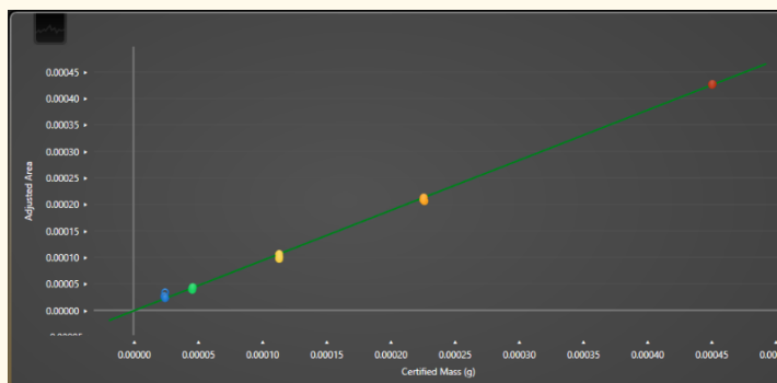
Figura 2. Recta de calibración para el azufre (S).

La calibración se llevó a cabo mediante una regresión lineal empleando cinco cantidades diferentes de un patrón de suelo, por triplicado. Para cada uno de los elementos (C, N y S) se obtuvo una recta de calibración con su correspondiente ecuación que correlaciona el área del pico con la cantidad de analito presente en la muestra, y su coeficiente de determinación (R 2 ). En la Figura 2 se muestra la recta de calibración y la ecuación obtenida para el S. Para el resto de elementos se obtuvieron valores de R 2 superiores al de la recta del S.