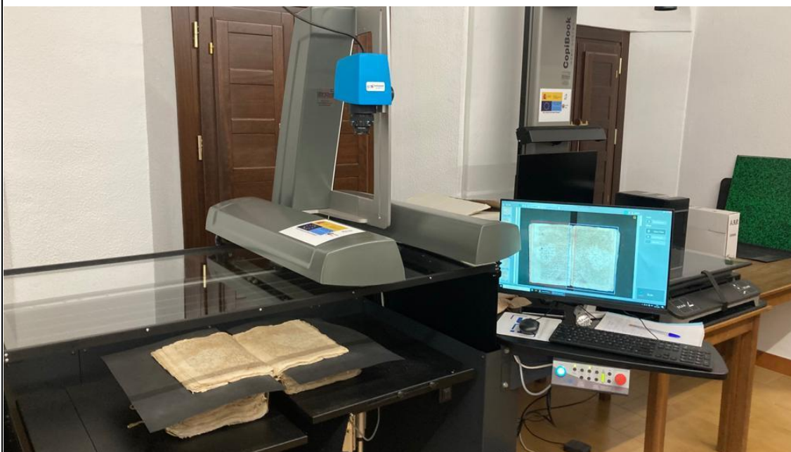
Escáner de gran formato Quark