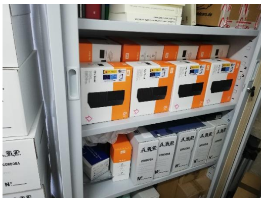
Discos duros de 8Teras para salvaguarda y traspaso de digitalizaciones a la Universidad