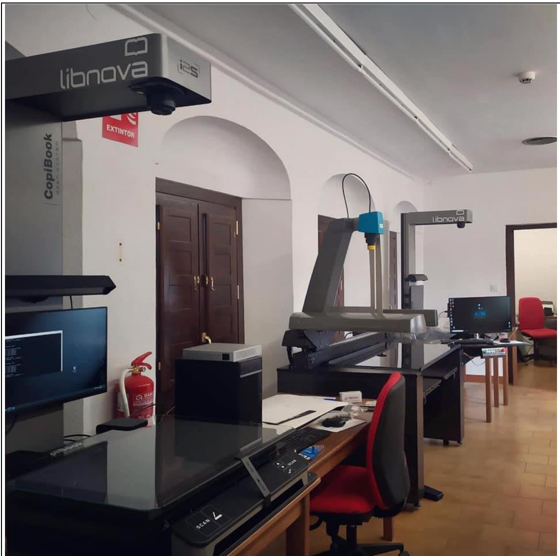
Vista Global de la plataforma de digitalización