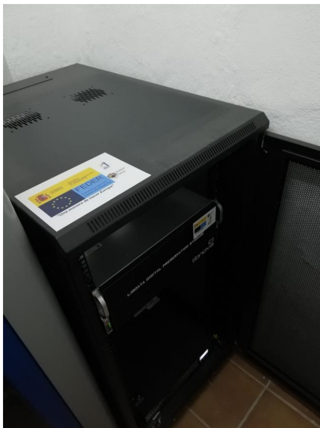
Armario de comunicaciones nº2 con NAS (Sistema de Almacenamiento en Red) y SAI (Sistema de Alimentación Ininterrumpida)