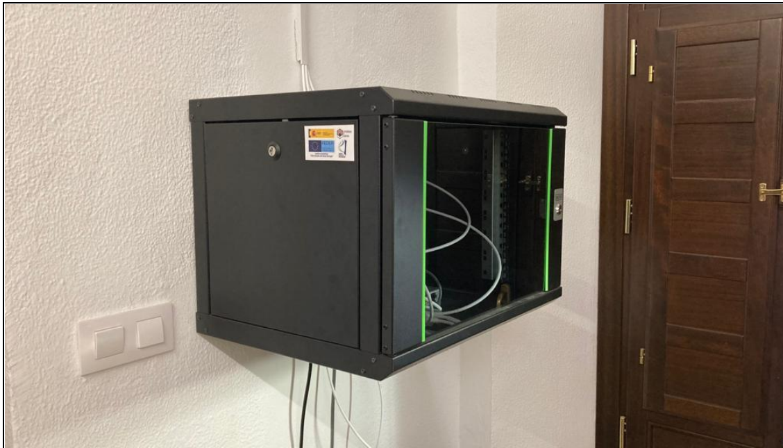
Armario de telecomunicaciones y switch de 8 puertos