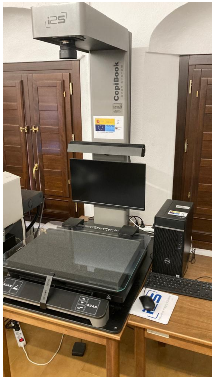
Escáner de alta velocidad Copibook 2