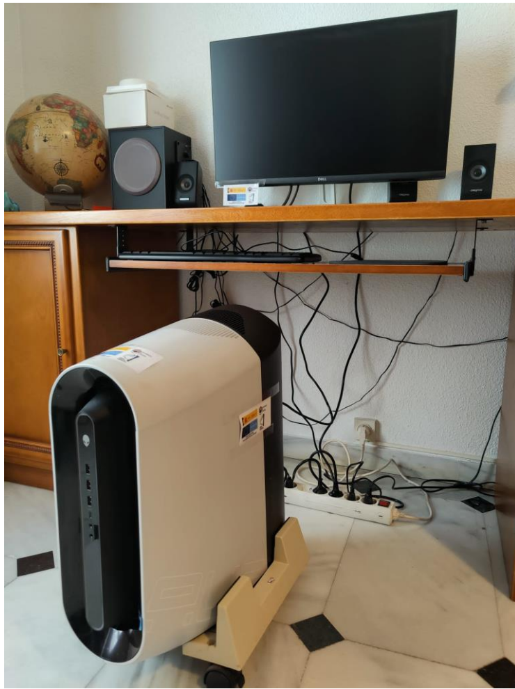
Estación de trabajo para levantamientos 3D