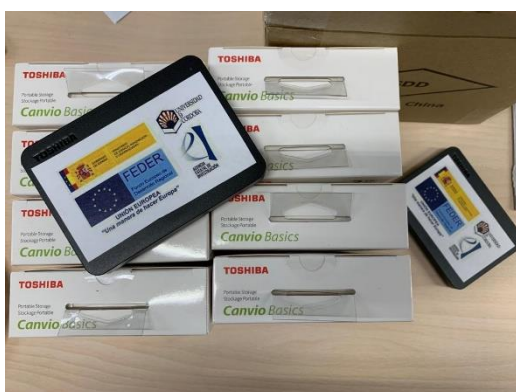
Discos duros de 2T para traspaso de digitalizaciones a investigadores