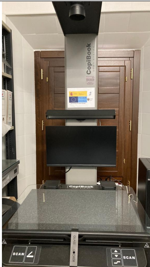
Escáner de alta velocidad Copibook 3