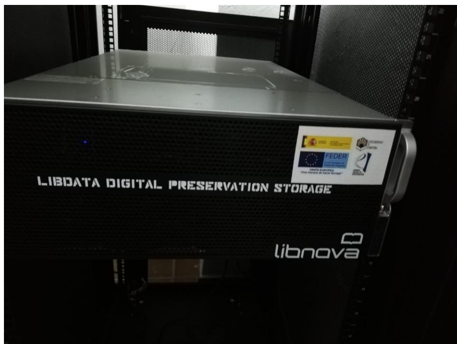
Detalle del NAS