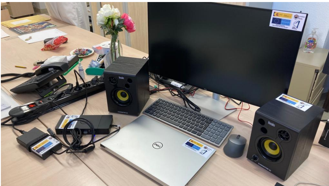
Estación de trabajo portátil