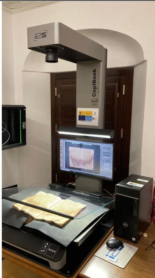
Escáner de alta velocidad Copibook 1