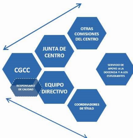
Figura 3. Estructura básica del Sistema de Garantía de Calidad del Centro

El SGC de la Facultad de Ciencias se integra en el Sistema de Calidad de la Universidad de Córdoba. La estructura básica del Sistema de Garantía de Calidad involucra a la Junta de Centro, al Equipo Directivo, a la Comisión de Garantía de Calidad, al responsable de Calidad de Centro, a los Coordinadores de cada Título, a las diferentes Comisiones del Centro y a los Servicios de Apoyo (para la docencia y estudiantado del campus) según se muestra en la Figura 3.