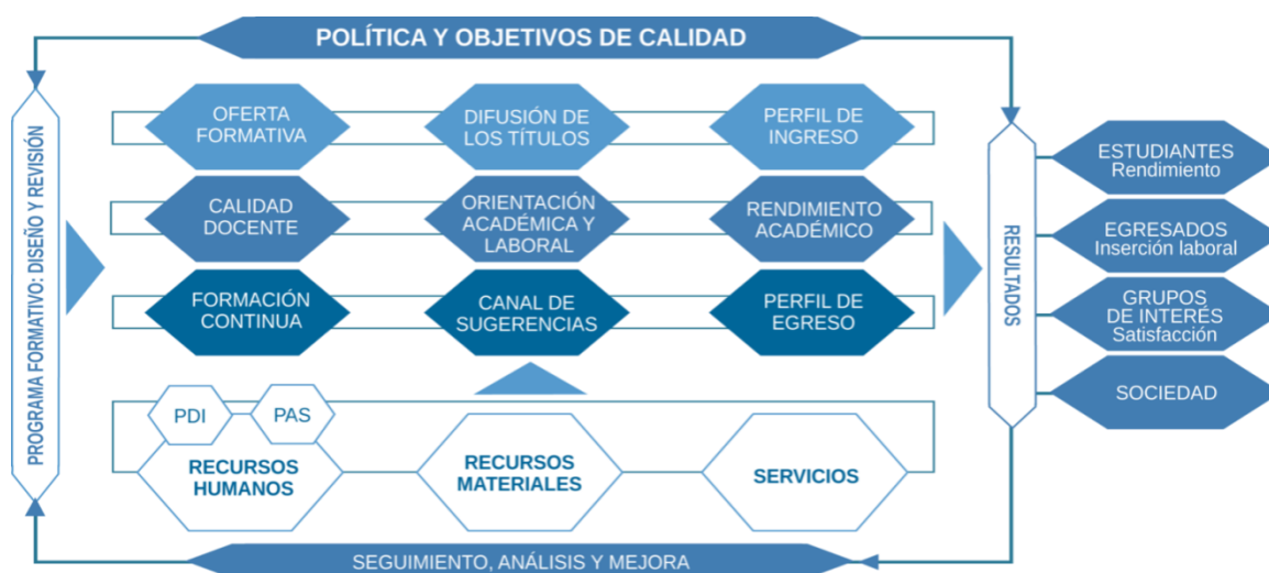
Figura 2. Esquema de objetivos enmarcados en el ciclo de mejora continua de los programas formativos.

VI.4. Establecer mecanismos que aseguren una gestión de la calidad de los TFG y, en su caso, de las prácticas externas y la movilidad.