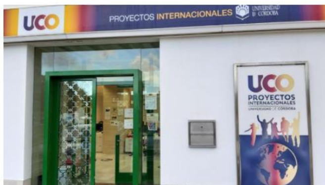
La UCO bate su récord de obtención de fondos para proyectos internacionales